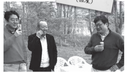
2013年5月、安倍首相、河口湖別荘で加計理事長、「総理が18年開学期限」と文科省に圧力の萩生田官房副長官(当時)と仲良く記念撮影(下記図表は東京新聞・4月11日)

面会日は2015年4月2日。それ以前に安倍首相と加計理事長は会食し、当時の下村文科大臣の「加計けしからん」発言への対応を相談。安倍首相は計画を知った時期についても、加計が国家戦略特区の事業者に決まった「17年1月20日」と答弁。ホント?このつじつま合わせに柳瀬氏がウソをつく構図。(図表は朝日新聞・5月12日)