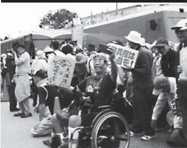
車椅子の集中行動参加者。沖繩の民意はどこに。JKさん撮影のカラー写真は後日ブログアップ。

「辺野古ゲート前連続6日間500人集中行動」参加報告 会員J・Kさんの辺野古の米軍キャンプ・シユワフ前の4月23日(月)〜28日(土)の抗議行動参加の記事です。辺野古へ行き、初めて座り込みに参加。初日は、朝から午後2時頃まで基地内に建築資材搬入タンクローリーを阻止。翌日は大量の機動隊員により、座り込み市民は強制排除されました。国土の0.6%の沖繩に、74%の米軍基地を押し付ける現状に申し訳なく思います。初日からの4日間で、約500台のタンクローリーを阻止できました。参加者は連日600〜800人で、東京・大阪・千葉・長野・石川など様々で、度々の参加者も大勢。最終日は、「4・28県民屈辱の日を忘れない県民集会」があり、1500人もの人が集まり、工事はストップしました。これ以上、沖繩に基地は絶対に作らせてはなりません。